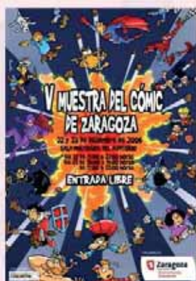
Año 2006 - A.J. Morata "Moratha" -