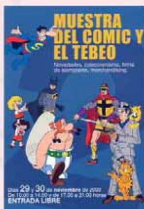
Año 2003 - Fco. Javier Castillo -