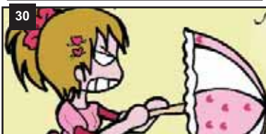
Petite Jolie y Mutsumi http://www.freewebs.com/girocultural