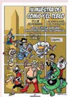
Año 2005 - J.A. Bernal "Bernal" -